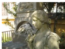
file: bodenhoffgrav.jpg (stor) – figureerne omkring den Bodenhoffske grav på Assistens dækker over en gyselig historie.