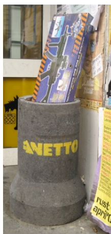
file: nettobrogadegun.jpg (mellem)