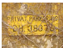
file: privatparkering.jpg (stor) – Nørrebro er berygtet for sine besværlige parkeringsforhold